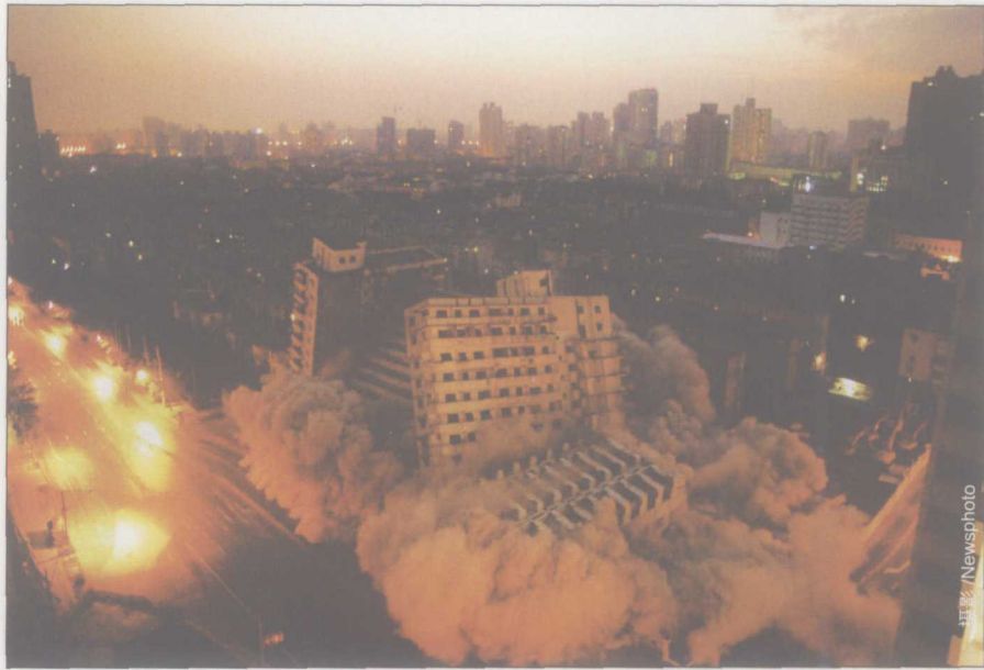
10月20日清晨，上海解放后首幢高层住宅“四平大楼”被爆破拆除。高速发展的城市经济，已使很多事情成为可能

实施效果，严重时甚至会出现上级规划无法在下级落实。因此，在国家或上级规划的编制中，一定要突出分类指导、区别对待的思想。