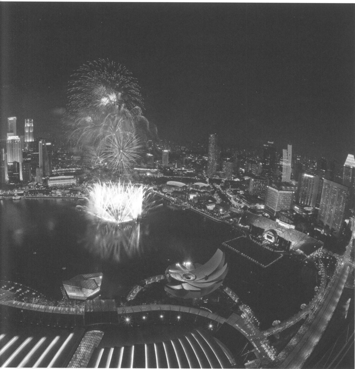
成立于1954年并于1959年开始执政的新加坡人民行动党成为世界上实行多党制国家中对国家掌控能力最强、执政时间最长的政党。图为2017年1月1日在新加坡滨海湾拍摄的新年焰火表演。

政策，在就业和教育方面向其倾斜。在社会发展安排上，实行组屋种族比例政策，使各族人口交错杂居，并通过组织大量社区基层生活加强彼此沟通和了解；实行一体化公民教育和国民服役；将各族节日均列为国家法定节日。在语言文化安排上，规定华语、英语、马来语、泰米尔语同为官方语言，并鼓励以英语为通用语言，以确保“无一种族占有优势”；领导人都会讲三至四种语言，这种做法可以极大地拉近领导人与其他族群听众间的感情，被各族民众认为领导人是“自己人”；塑造各种族共同国家认同和