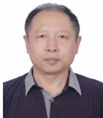
本文作者：剧锦文 中国社会科学院经济研究所 研究员、博士生导师，中国社 会科学院民营经济研究中心 秘书长，中国发展战略学研 会副理事长。

其六，越来越多的民营企业积极自觉承担社会责任。积极承担社会责任是现代企业的重要标志。初创期的民营企业普遍规模小、实力不足，许多企业甚至是负债经营。在这种情况下，出现了一些企业为自身发展，更看重眼前利益，甚至不惜牺牲社会公众利益的现象。随着企业的发展壮大，民营企业家的社会责任意识普遍增强，已经从只关注企业自身发展向关注自身与社会发展并重转变，其中一个重要表现是积极投身社会公益与慈善事业。从光彩事业到希望工程，从扶危济困到抗震救灾，从支持社区建设到投身精准扶贫，许多民营企业家都不同程度地参与。福耀玻璃创始人曹德旺就是其中典范。