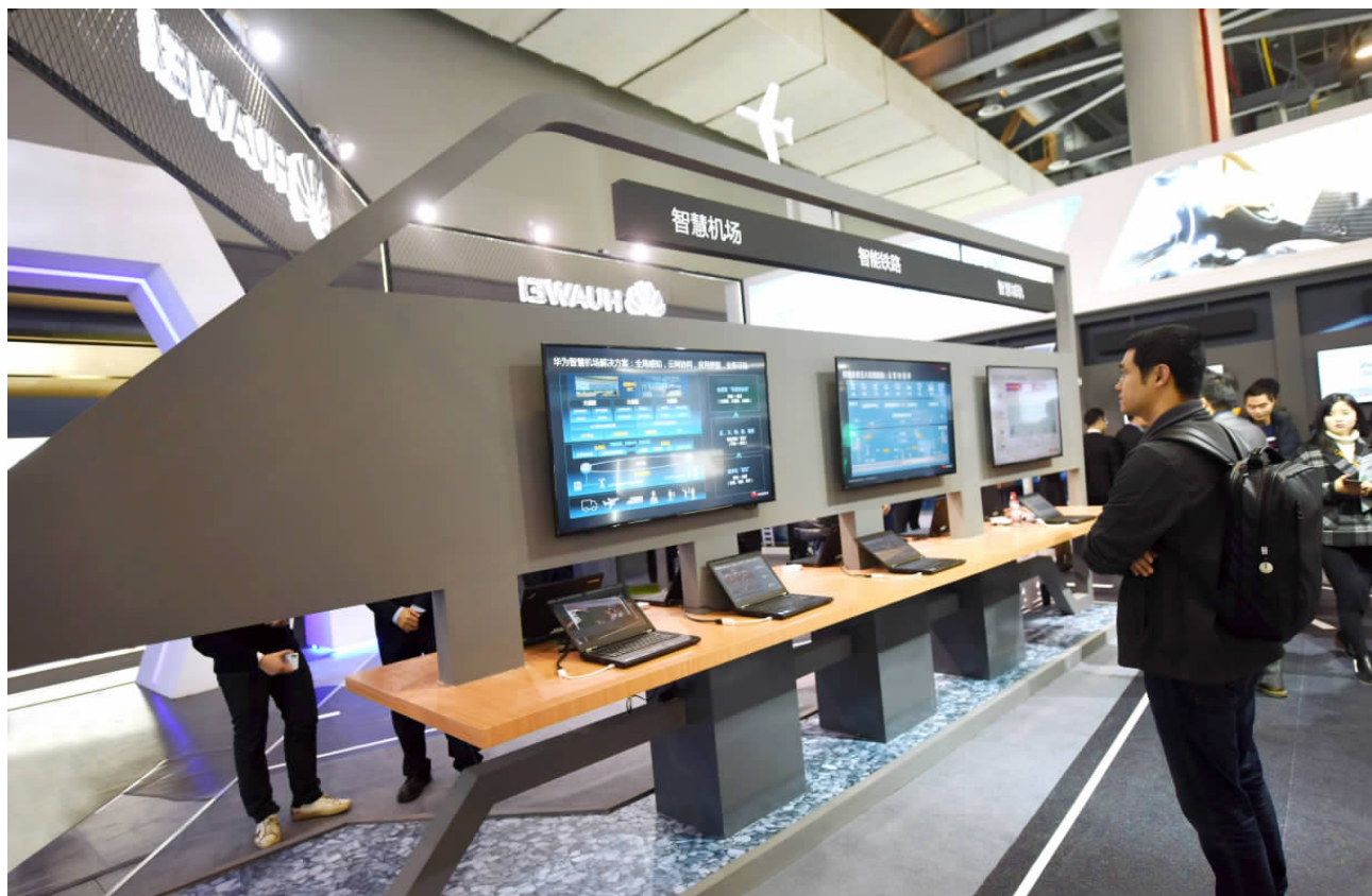
① 民营企业已经占中国专利申请的80%以上、发明专利的60%以上、新产品提供的70%以上，为科技兴国做出了巨大贡献。图为华为利用5G技术推出的智慧机场控制系统。

人提出所谓“民营经济离场论”，说民营经济已经完成使命，要退出历史舞台；有的人提出所谓“新公私合营论”，把现在的混合所有制改革曲解为新一轮“公私合营”；有的人说加强企业党建和工会工作是要对民营企业进行控制，等等。对这些奇谈怪论，习近平总书记在座谈会上明确指出：“这些说法是完全错误的，不符合党的大政方针。”