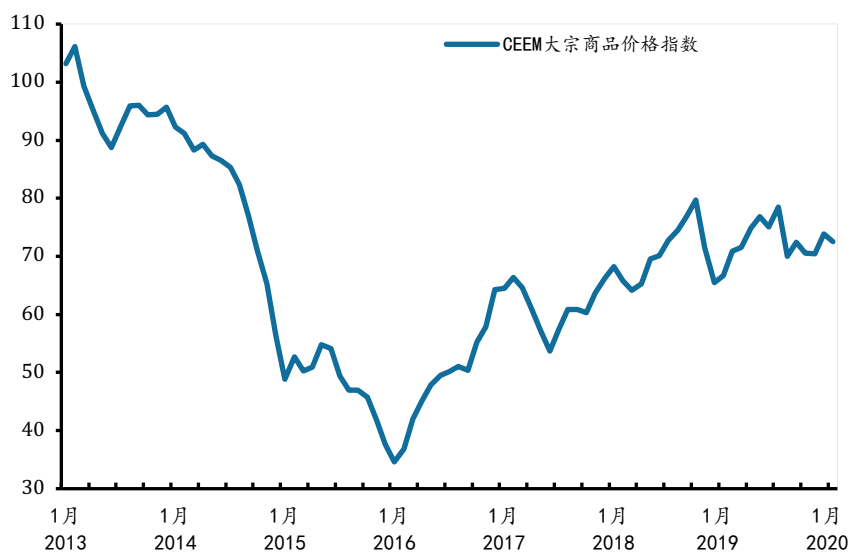
图 3 全球大宗商品价格：2020 年 1 月