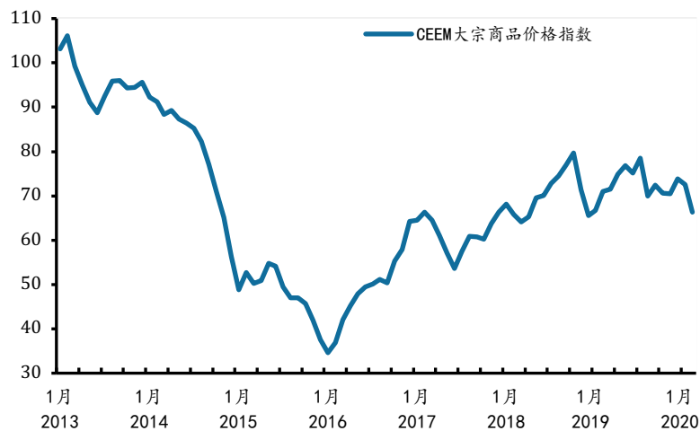
图3 全球大宗商品价格：2020年2月