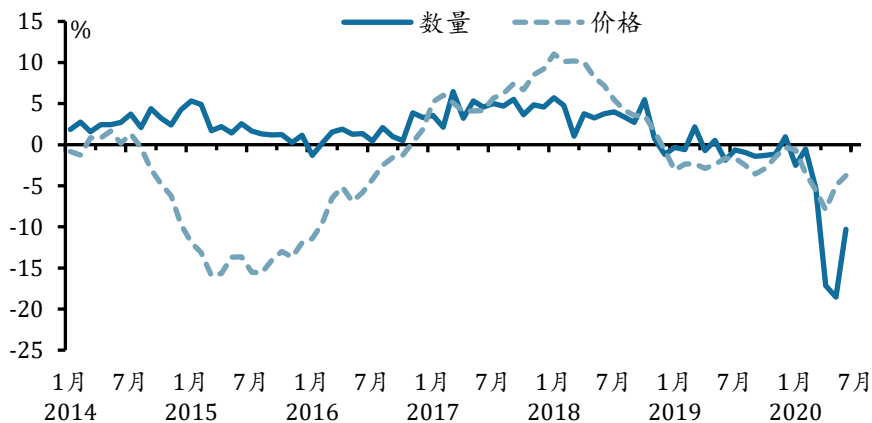
图2 全球出口贸易：数量和价格的同比增速